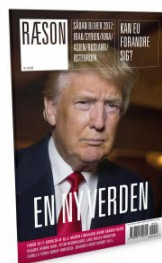
RÆSON29: EN NY VERDEN