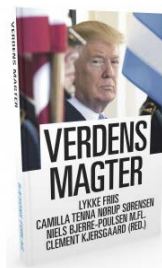
VERDEN'S MAGTER (2017)

Men betragtes tidsperioden i tabel 2 i sin næsten 45-årige helhed, er det tydeligt, at denne skepsis er standarden mere end undtagelsen: Borgerne har i det meste af de fire årtier været lunkne i vurderingen af politikernes beslutningsevner – undtagelsen er i