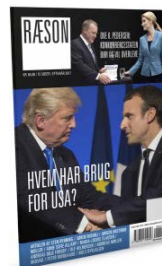
RÆSON31: HVEM HAR BRUG FOR USA?